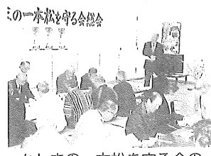
かしまの一本松を守る会の

南相馬市鹿島区の海岸で東日本大震災の津波に耐えた「奇跡の一本松」を守ろうと、保全に取り組んできた地域住民が幅広く協力する組織として「南相馬 かしまの一本松を守る会」を6日、南相馬市鹿島区で設立した。 役員には、初年度に「い」とあいつ、初年度に役員選出では、会長に五智取組む事業を決めた。役 子や孫と離れて高年齢者に孤立感本県被災地の離散家族東日本大震災や東京電力 仮設住宅で談笑する半谷と近藤さん