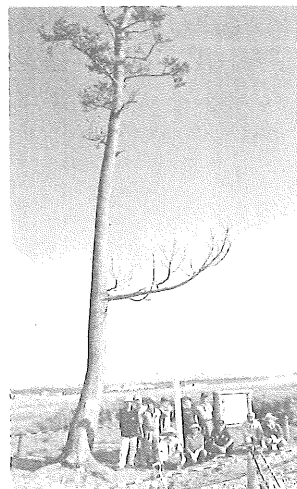
震災の津波に耐えた「奇跡の一本松」=昨年9月